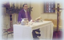
Ritiro quaresimale parrocchiale: Gesù e il nostro tempo