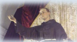
San Salvatore da Horta: la festa esterna