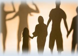
Amare i genitori, amare il prossimo