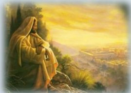
La Grazia della Pasqua: risorgere con Cristo