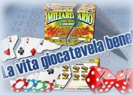
Contro il gioco d'azzardo: la raccolta firme parrocchiale