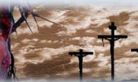
"Processo a Gesù" e "Eja Mater fons amoris": la Passione in "opera"